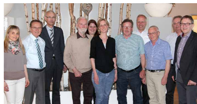
Verabschiedung der zurückgetretenen Chefexpertinnen und Chefexperten an der Sitzung vom 15. April 2015

Die Inspektionen in den erwähnten Berufen zeigten ein durchwegs erfreuliches Resultat. Die verschiedenen Gespräche mit den am Qualifikationsverfahren beteiligten Personen liessen erkennen, dass sowohl in der Prüfungsvorbereitung als auch in der Prüfungsdurchführung reglementskonform und professionell gearbeitet wurde.